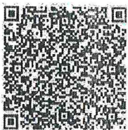
แบบสอบถามฯ

โดยขอให้องค์กรปกครองส่วนท้องถิ่นดำเนินการตอบแบบสอบถาม ภายในวันที่ ๓๐ เมษายน ๒๕๖๗ ทั้งนี้ ขอให้จังหวัดที่ดำเนินการครบถ้วนแล้ว รายงานผลการดำเนินงานตามแบบฟอร์มที่กำหนด รายละเอียดปรากฏตาม QR Code ท้ายหนังสือฉบับนี้