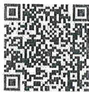
แบบฟอร์มรายงาน